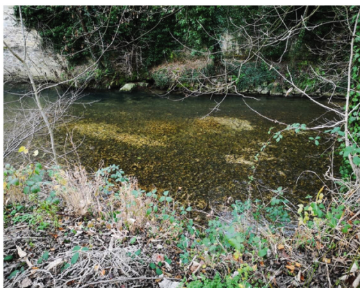
Frayère : zone où les poissons déposent leurs œufs.

Ainsi, en Tarentaise, les travaux en cours d'eau sont interdits du 15 octobre au 15 avril ! Cette période correspond à la période de frais (reproduction) de nos poissons de montagne (saumons, truite, ombles, ombres, corégones).